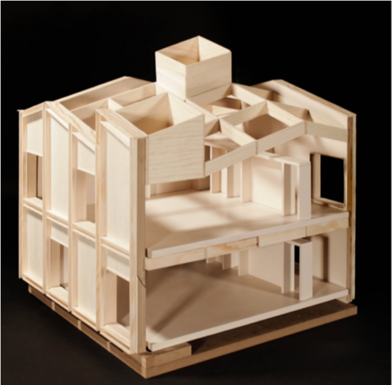
Modell av ateljéhus för Duved 5 av Carmen Izquierdo

Det är också många, både individer och företag, som har intresse av Duved och Åredalen som möjlighet till livsstilsflytt, att bo och verka hel- eller deltid i Duved/Åre då det där finns ett utbud både av människor, företag, mat och service – samt natur och idrott – som lockar. Genom dagens teknologi kan man ändå ha kontakt med och arbeta genom arbetsgivaren/storstaden. Därför är kombinationen av tillgänglighet (dvs inte för hög prisnivå), boende, arbete, mat och dryck, utbud av attraktion/destination/handel av vikt för Duveds tillväxt och utveckling.